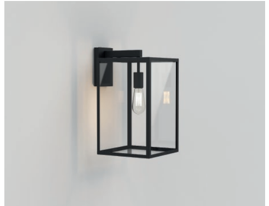
CODE: 1354007 (8504) FINISH: TEXTURED BLACK

THIS PRODUCT IS NOT SUITABLE FOR INSTALLATION WITHIN FIVE MILES OF THE COAST. FOR THESE ENVIRONMENTS, PLEASE FILTER PRODUCTS ON THE ASTRO WEBSITE BY 'COASTAL'.